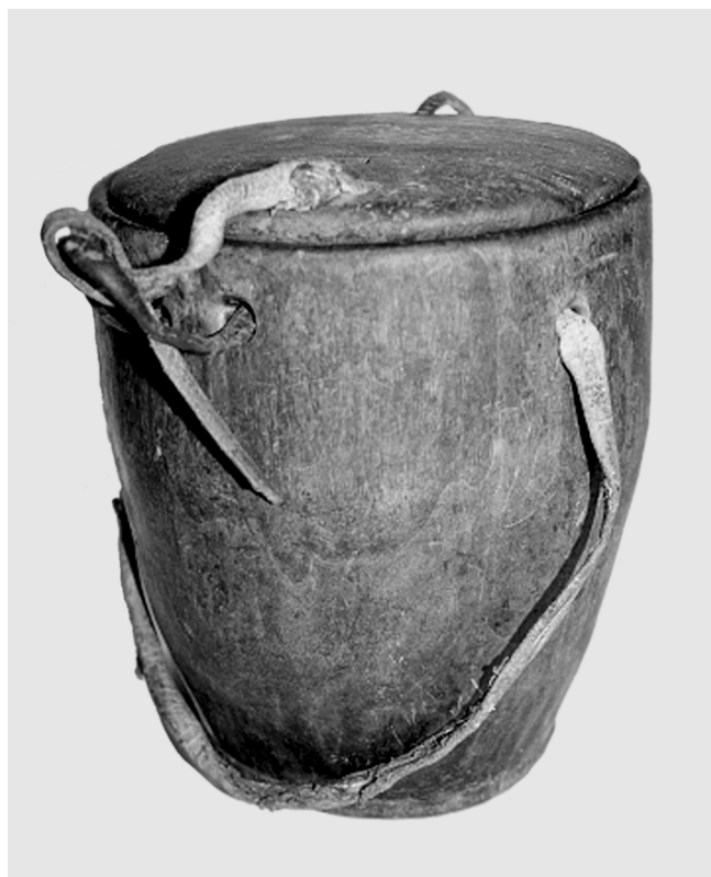
Деревянный “шыныкап”. Монголия. Баян-Ульгийский аймак. Сумон Алтанцоц. Монгольская комплексная экспедиция. 2007 г.

“Шай дорба”, или “шай калта”, – подставки под чайники, прихватки – изготавливались самими хозяйками специально или из износившихся изделий: текеметов, сырмаков и тускиизов. Например, образцы “шай калта” из Западной Монголии представляют собой обычную прямоугольную сумку на ляжке. Лицевая сторона сумки украшена вышивкой в виде казахского орнамента. Внутри сумки клали плитку чая