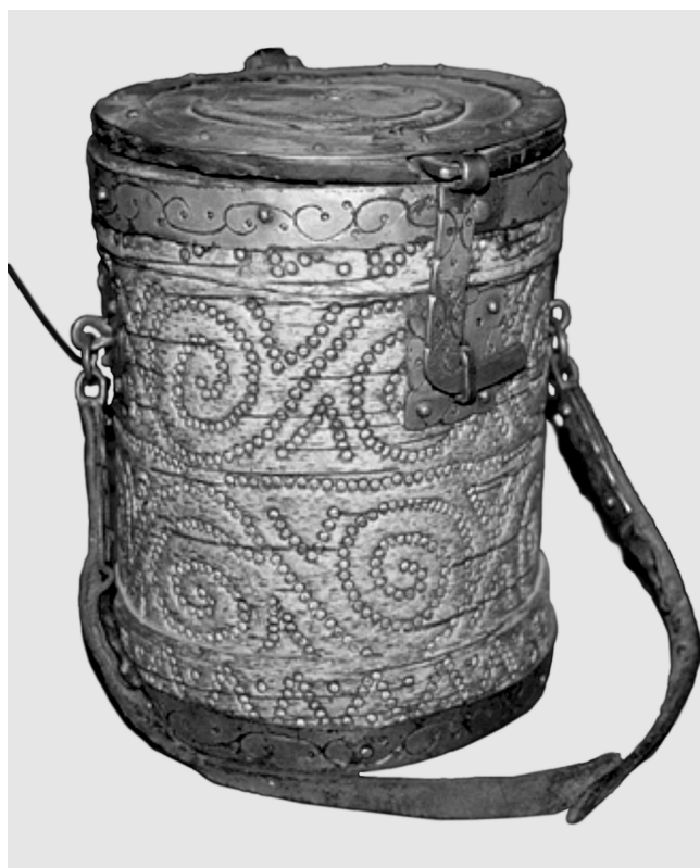
“Шыныкап” из бересты. Монголия. Баян-Ульгийский аймак. Сумон Алтанцогц. Монгольская комплексная экспедиция. 2007 г.